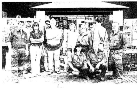
I volontari del G.e.v. al loro banchetto

L'iniziativa. Spettacolo, musica, stand: una giornata speciale nel segno della solidarietà