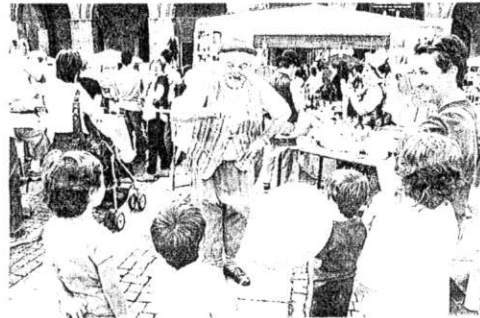
I clown hanno regalato sorrisi ai più piccoli