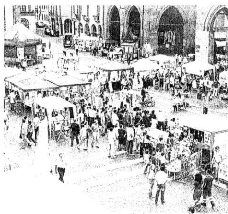
Una veduta dall'alto di piazza del Comune

Gli eventi collaterali di 'VolontariaMente Giovani' proseguiranno sino alla fine di ottobre. Domani il centro per le famiglie di via Brescia ospiterà alle 17 l'incontro con le associazioni della provincia che attuano il sostegno a distanza: l'iniziativa è organizzata da Comune e Provincia di Cremona con gli enti locali aderenti all'El-sad. Il 20 ottobre la Compagnia Teatrale Itineraria proporrà al teatro Monteverdi di via Dante (alle 10 per gli studenti delle scuole superiori e alle 21.30 per volontari e famiglie) lo spettacolo 'H2Oro'. Il giorno successivo, alle 9, ancora al teatro Monteverdi, si svolgerà l'incontro 'Il punto sulla prevenzione delle dipendenze - passato e futuro' curato dal Centro Studi; interverranno Leopoldo Grosso e Ludovico Grasso del Gruppo Abele di Torino. Il 27 ottobre, alle 10.30, nella sede del Cisol di via San Bernardo si terrà l'incontro pubblico (curato da Provincia di Cremona e Cisol) dal titolo 'Il punto su associazionismo e promozione sociale: le modifiche della legge regionale 5/2006'.