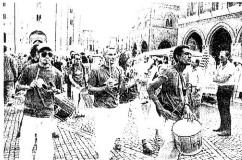
I Brasil Samba si sono esibiti nel cuore della città